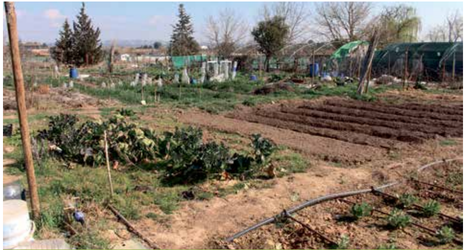
↻ Huertos en terrenos municipales.

Los interesados pueden ir al Ayuntamiento y dejar sus datos, a partir de ahí se pondrá en contacto a las partes para