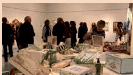
La exposición de los trabajos que se desarrollan en el Taller de Artes a lo largo del año tuvo gran afluencia de visitantes.