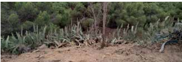
↻ Zona donde se realizarán los trabajos de estabilización del talud.

Al mismo tiempo, también se harán trabajos de estabilización del talud de la ermita, mediante la técnica de “empalizada viva”, para evitar la erosión al haber eliminado gran parte de las chumberas existentes, ya que se trata de una especie exótica invasora que se extendía con gran rapidez por los terrenos y que impedía la proliferación de otras especies autóctonas.