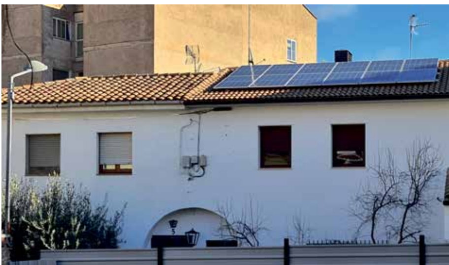
Los tejados de muchos inmuebles binefarense ya incorporan placas fotovoltaicas.