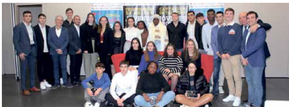
El Club Judo Binéfar fue el más galardonado en la gala de Fajyda.