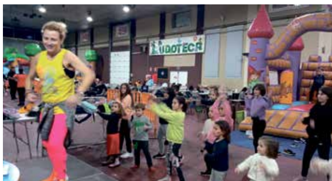
El recinto de Diverbiner tuvo buena ocupación en todas sus sesiones.

Diverbiner cerró la edición de 2022 con un exitoso registro de participantes, puesto que se cubrió el aforo todos los días que el parque infantil que organiza el Ayuntamiento de Binéfar desde la Ludoteca Municipal estuvo abierto. La mayor afluencia de usuarios se produjo por la mañana, pero también las tardes estuvieron muy concurridas y los asistentes pudieron disfrutar de toda la oferta de ocio que se presenta, como talleres, juegos, hinchables, clases de baile, karaoke, maquillaje y demás rincones de actividad.