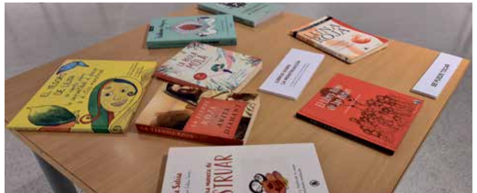
La exposición permaneció abierta en la sala de la Casa Consistorial.

El espacio combinaba la educación, el arte y la ecología. A través de diversas actividades, dinámicas participativas y materiales de carácter lúdico de la línea educativa “Bienvenida a la Vida Cíclica” enseña que la menstruación es natural, que forma parte del ciclo de la vida y, de esta manera, se contribuye a