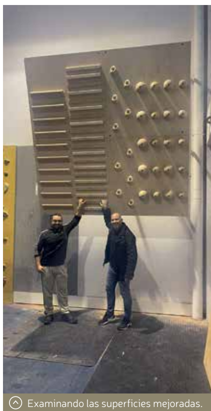
Examinando las superficies mejoradas.

En cuanto a la adquisición e instalación de un autoasegurador en el rocódromo -por importe de 2.798,73 euros-, para permitir la escalada de