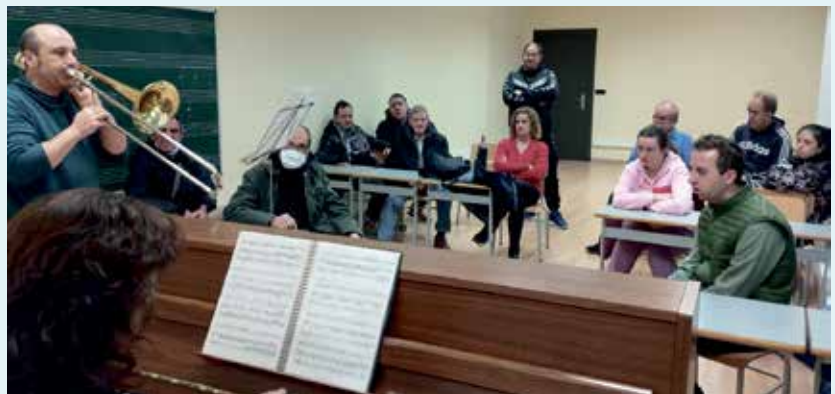
El grupo disfrutó de las instalaciones de la Escuela de Música.

La Escuela Municipal de Música de Binéfar recibió el pasado mes de enero a un grupo de usuarios del centro asistencial para discapacitados intelectuales Sant Joan de Déu Terres de Lleida (Almacellas). El grupo visitó las instalaciones, probó a tocar algunos instrumentos y el personal de la escuela les obsequió con un pequeño concierto musical. Fue un placer colaborar en el disfrute de la música por parte de este grupo que, además, forma parte de una especial banda musical.